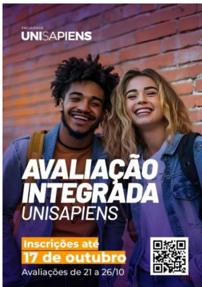
Figura 2. Avaliação integrada Unisapiens

Esse novo instrumento foi criado para acompanhar e fortalecer o desenvolvimento acadêmico dos discentes em relação ao ENADE. No contexto dessa avaliação integrada, os coordenadores de curso que participam do ciclo